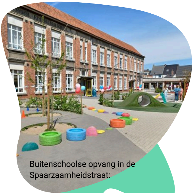
Buitenschoolse opvang in de Spaarzaamheidstraat: